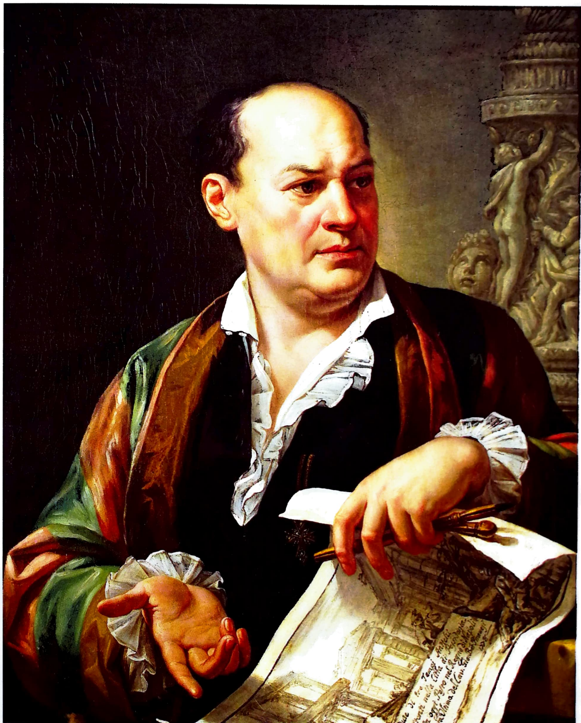
Pietro Labruzzi. Ritratto di Giovanni Battista Piranesi (1779). Olio su tela, Roma, Museo di Roma.